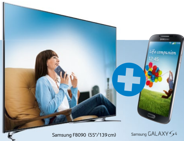
Samsung F8090 (55"/139 cm)

1 Premium Smart TV kaufen. 1 GALAXY S4 oder S3 gratis bekommen.