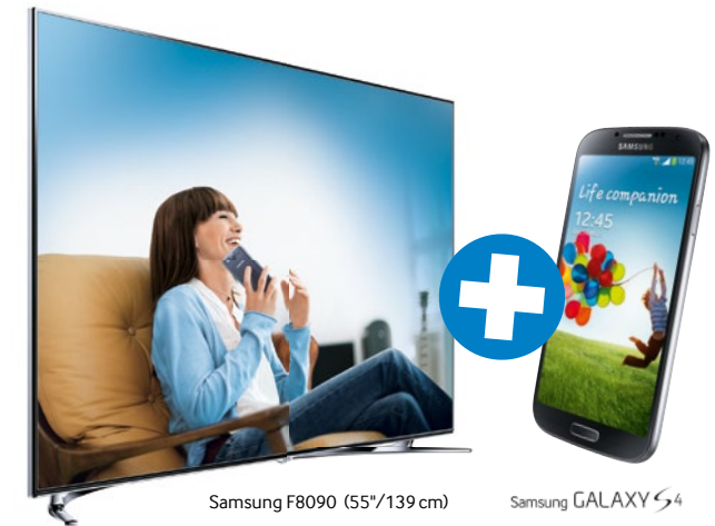
Samsung F8090 (55"/139 cm)

1 Premium Smart TV kaufen. 1 GALAXY S4 oder S3 gratis bekommen.*