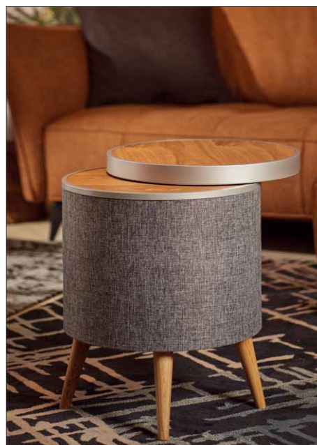
Bei den Farbvarianten Magic (links) und Eiche (rechts) sind die Tischplatten aus Holz