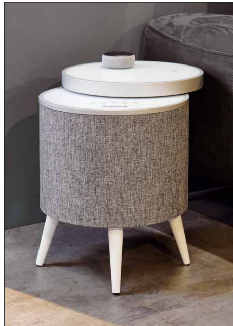
Die schwarze und die weiße Version besitzen eine robuste Glasplatte

richtige Ambiente im Wohnzimmer auch nicht fehlen. Das hat sich auch Audioblock gedacht und den Helsinki zudem mit einer steuerbaren Lichtleiste am Rumpf ausgestattet. Die Lichter werden durch einmaliges Drücken des Lampensymbols durchgeschaltet. Die Farben wechseln dann zwischen Grün, Lila, Pink, Gelb, Blau, Babyblau, Weiß und Rot. Durch das Gedrückthalten der Taste kann die Lichtleiste komplett ausgeschaltet werden.