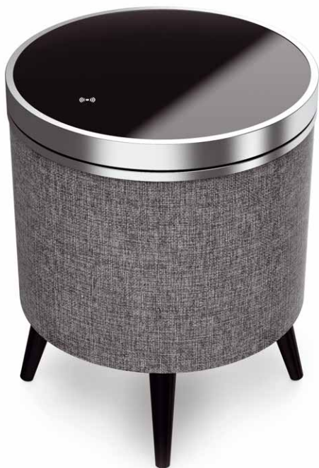
Unter der schwenkbaren Tischplatte befinden sich die Steuerelemente